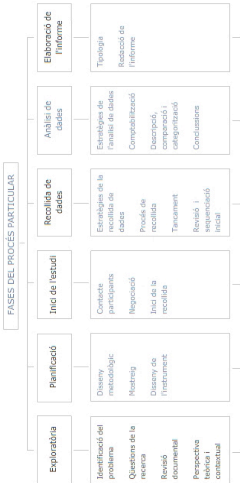
Fig. 5_2. Esquema de les fases seguides en aquesta tesi, basades en la proposta de procés d'Arnal et al. 1996.